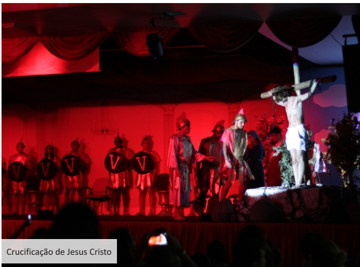
Crucificação de Jesus Cristo

Vida . Na ocasião, a Direção nos presenteou com um delicioso ovo de chocolate. Para culminarmos as Celebrações Pascais, apreciamos com os estudantes da Educação Infantil e do Ensino Fundamental I, o Tríduo Pascal. Por meio de uma linda encenação teatral, os discentes dramatizaram relatos da Entrada Triunfal de Jesus em Jerusalém , a Celebração do Lava-Pés e a Instituição da Eucaristia (Santa Ceia) . Acreditamos que esses momentos provocaram em todos profunda reflexão sobre nossas vivências cotidianas da fé e valorização do maior ato de amor realizado por Jesus em prol de cada um de nós: morrer para nos salvar e nos dar vida nova.