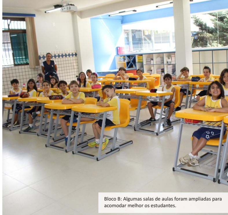
Bloco B: Algumas salas de aulas foram ampliadas para acomodar melhor os estudantes.