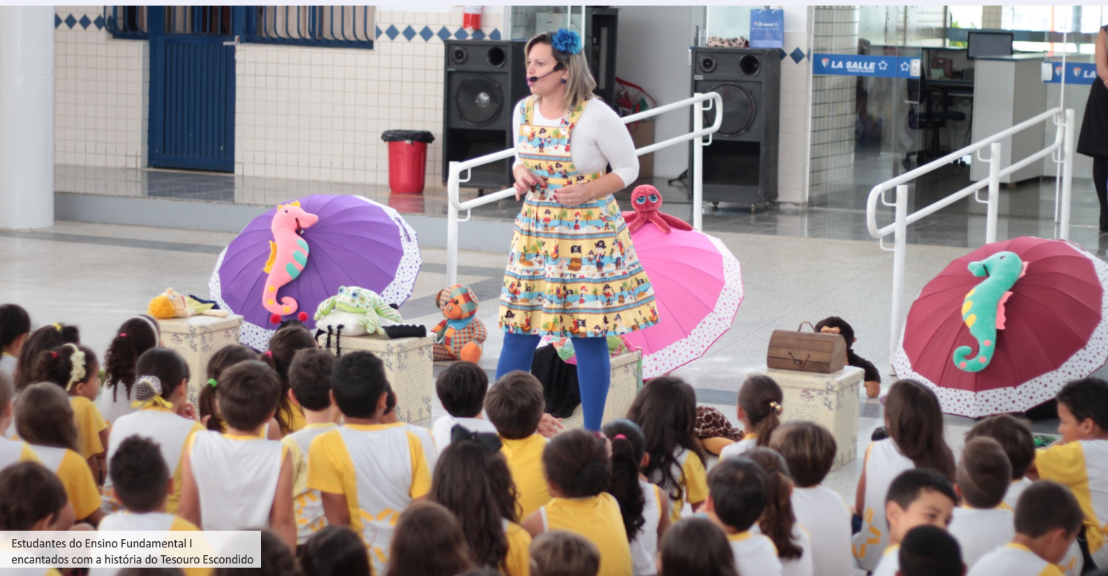
Estudantes do Ensino Fundamental I encantados com a história do Tesouro Escondido

A literatura é muito importante, pois quando inserida no mundo de nossos estudantes desde pequenos, auxilia no desenvolvimento de opinião crítica, projeções de novos horizontes e ampliação da criatividade. Além de aumentar o conhecimento, o hábito da leitura aprimora o vocabulário e a capacidade de escrita. Abre as janelas da alma, pois, o contato com os livros proporciona “a dupla delícia: a vantagem de a gente poder estar só e ao mesmo tempo acompanhado” (Mário Quintana). Por isso, iniciamos o ano com o projeto “Ciranda da Leitura”.