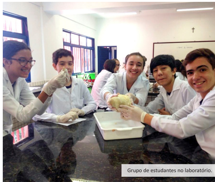
Grupo de estudantes no laboratório.

O Ensino Médio é uma fase decisiva na vida do adolescente. É quando, além de ter de se adaptar a várias mudanças, faz-se necessário também começar a traçar o futuro acadêmico e profissional. A fim de facilitar esse momento e trazer menos impacto aos nossos estudantes, reformulamos o 9º ano do Ensino Fundamental.