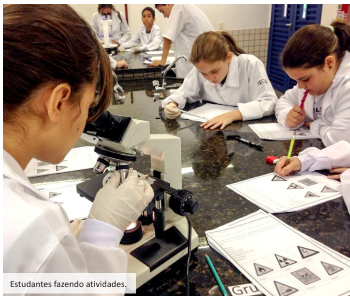
Estudantes fazendo atividades.