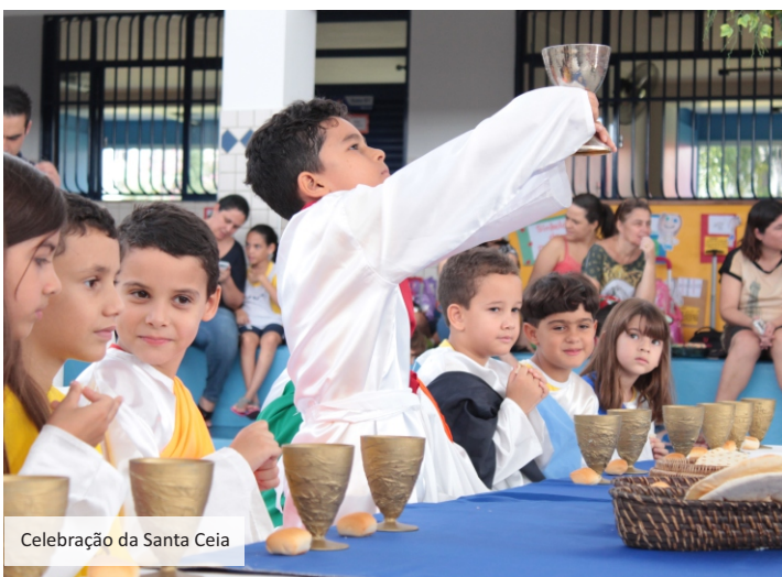
Celebração da Santa Ceia