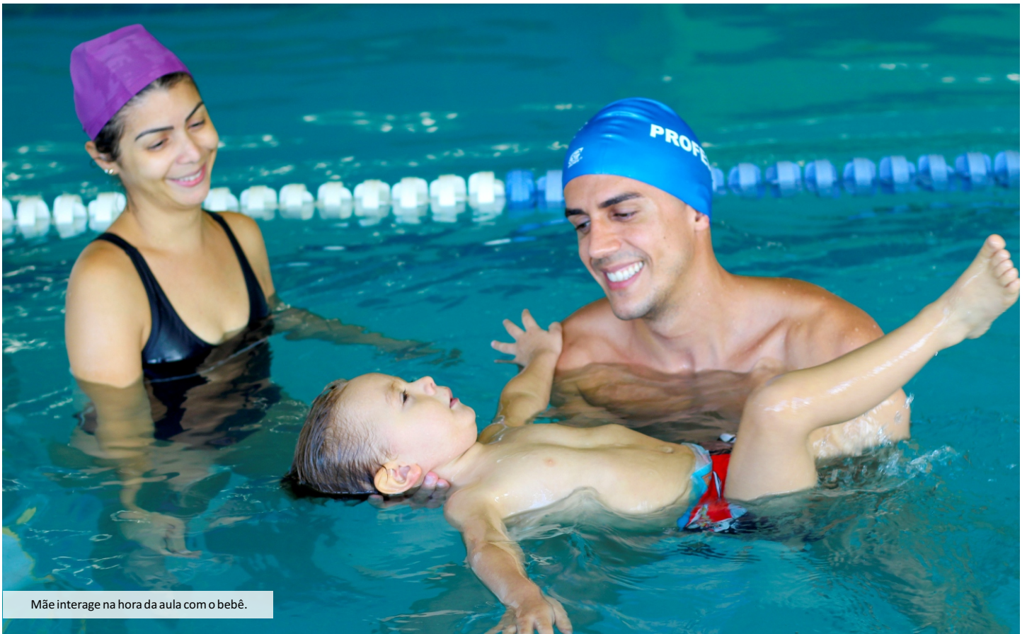
Mãe interage na hora da aula com o bebê.

Consideráveis são os ganhos que o ingresso de bebês na Natação acarreta em seu desenvolvimento, já que além de ativar sua memória uterina, traz conforto e bem-estar em contato com o meio líquido. Piaget demonstra com clareza que a fase de zero a dois anos é extremamente rica e que a inteligência começa a se estruturar e mostrar seu valor antes mesmo da linguagem. Por isso, a importância dessa prática no início da vida.