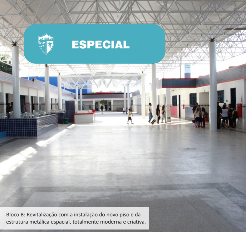
Bloco B: Revitalização com a instalação do novo piso e da estrutura metálica espacial, totalmente moderna e criativa.