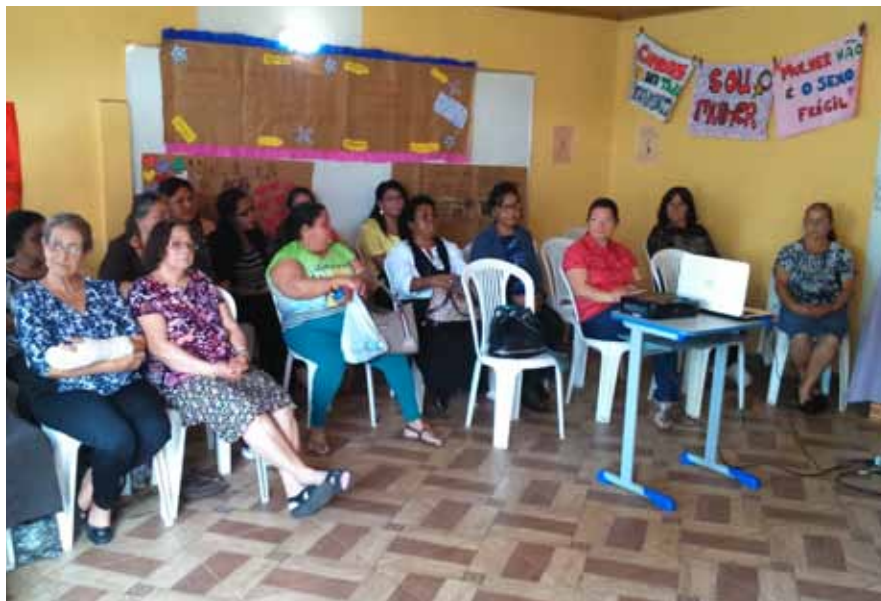
Capacitação se deu em quatro eixos temáticos

Coordenação de Planejamento da Fundação La Salle