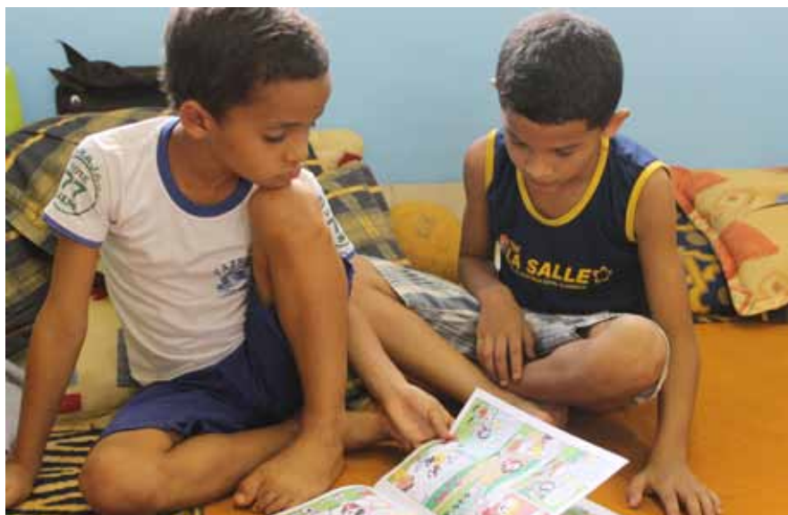
São expressivos os resultados sociais das contribuições das obras de Altamira e Uruará