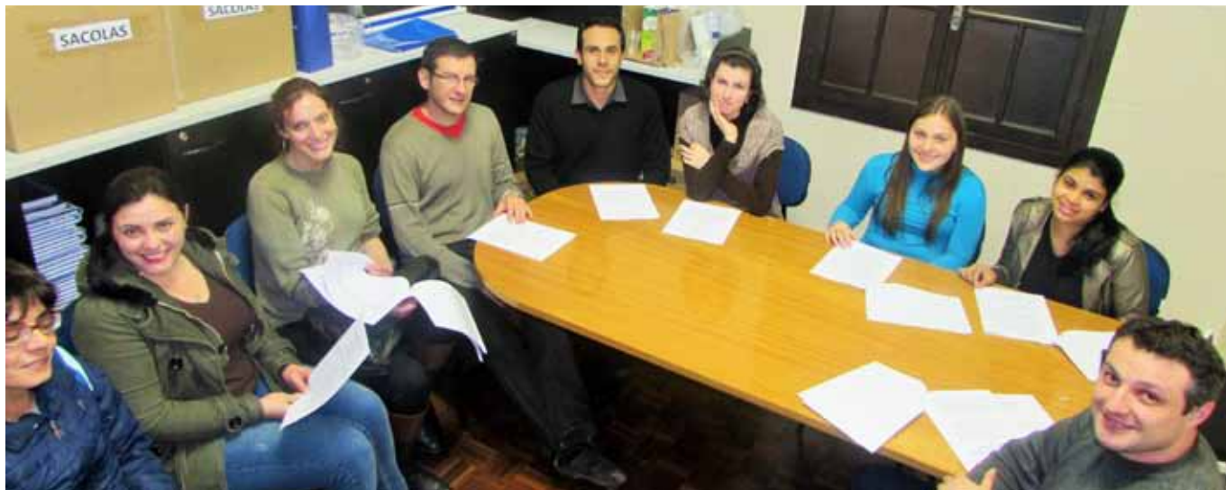
Atividades foram desenvolvidas pelos professores com os acadêmicos, conforme calendário definido na Faculdade

Ouvidoria Institucional, Coordenação da Comissão Própria de Avaliação e docente da Faculdade La Salle Caxias do Sul