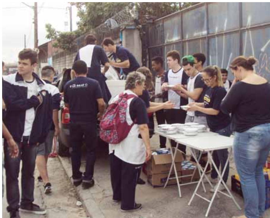
Atividade do La Salle São Paulo beneficiou moradores de rua