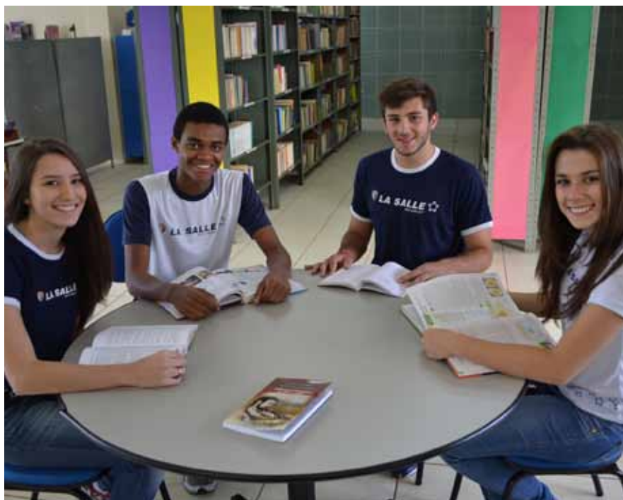
Os aprendizes têm histórias e itinerários singulares. Na foto, alunos do La Salle São Carlos

fundamentais para a excelência das aprendizagens.