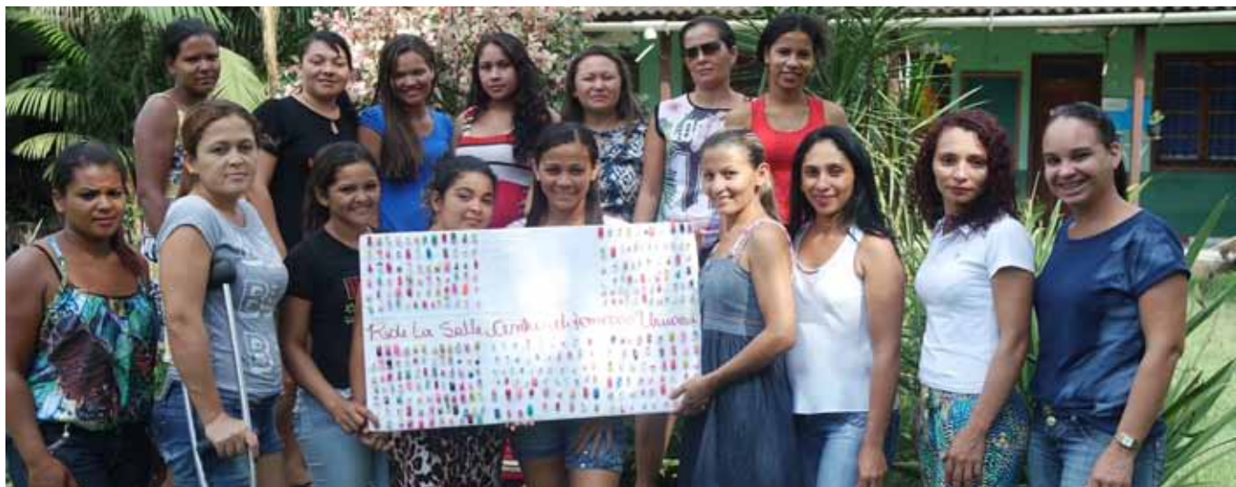
Curso de Técnicas de Embelezamento de Pés e Mãos

O Centro de Formação La Salle este ano ofertou 29 turmas de cursos livres, totalizando 543 usuários beneficiados.