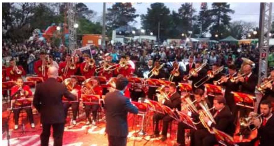
Banda Marcial São João atua em plena atividade há 55 anos

Setor de Comunicação e Marketing da Rede La Salle