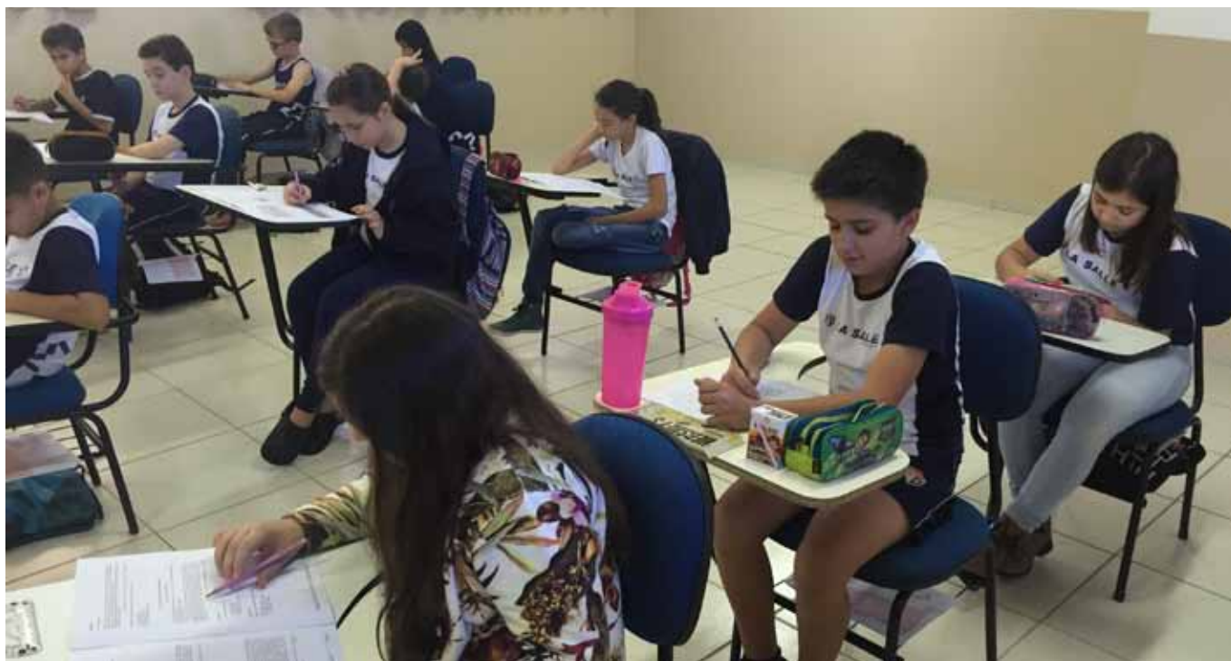
Avaliação de Conhecimentos 2015 realizada no Colégio La Salle São Carlos

Há alguns anos, a Rede La Salle vem realizando a Avaliação de Conhecimentos em suas Comunidades Educativas de Educação Básica. Seu objetivo é promover a melhoria dos processos de aprendizagem das escolas lassalistas, assumindo uma dimensão formadora. Permite, assim, que haja uma reflexão sobre a ação pedagógica, apontando caminhos para fazer emergir novas práticas educativas. A Avaliação não é vista, porém, de modo isolado, apenas para “dar nota ao aluno”.