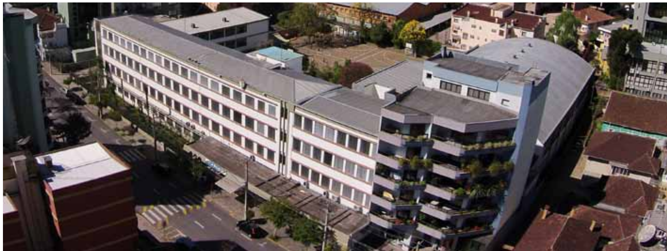
La Salle Caxias completa 80 anos em fevereiro de 2016

O Colégio La Salle Caxias, de Caxias do Sul/RS, foi fundado em 14 de fevereiro de 1936, graças à iniciativa da Associação de Ex-alunos do então Colégio Nossa Senhora do Carmo.