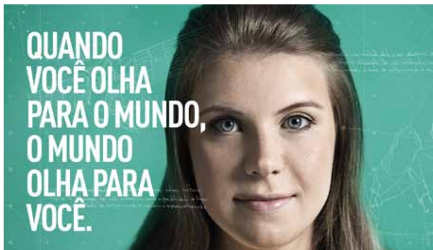
Trabalho com posicionamento definido teve início na Campanha de Vestibular 2015/2

Este novo caminho oportuniza à Rede La Salle fortalecer-se no contexto educacional com um apelo especial, enfatizando justamente o que sua história secular – mas tão contemporânea – significa: tradição e qualidade, valores globais e proximidade.