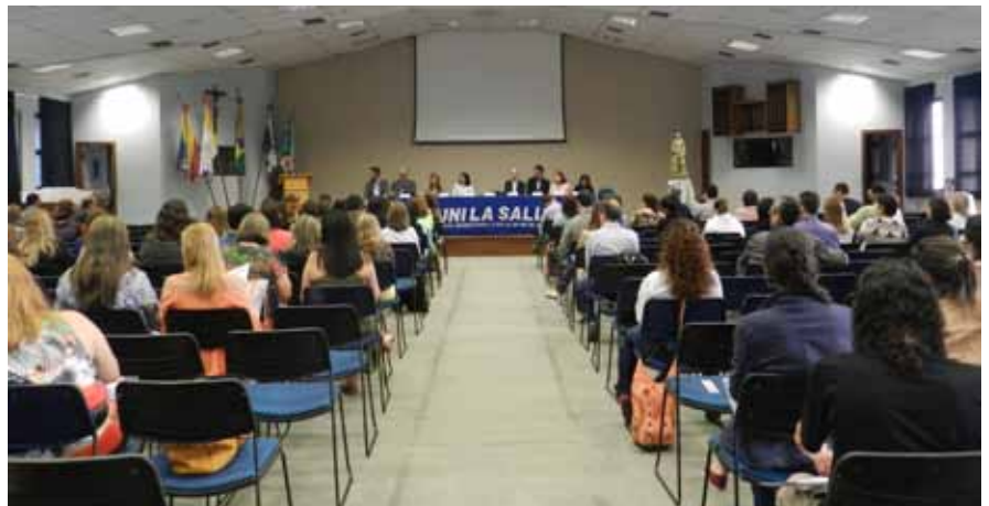
Seminário Pedagógico 2015 do Unilasalle Rio de Janeiro

Em qualquer lugar e tempo, o primeiro fator de propaganda de uma escola sempre foi o que hoje se chama de endomarketing, que resulta na busca de um produto pela qualidade deste e das pessoas que o oferecem, e que é feito pelos próprios usuários – no caso, da educação da “escola cristã” – que experienciam essa qualidade e que sentem prazer em ir a esta escola e em frequentá-la (HENGEMÜLE, 2007, p. 44).