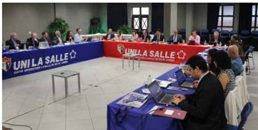
Reunião de Dirigentes das IES, em Niterói/RJ

Assim como a Educação Básica, a Educação Superior também vivencia a oportunidade dos encontros semestrais. Em novembro, aconteceu a Reunião de Dirigentes das IES no Unilasalle Rio de Janeiro. O tema norteador foi a proposição de metas do planejamento estratégico para 2016.