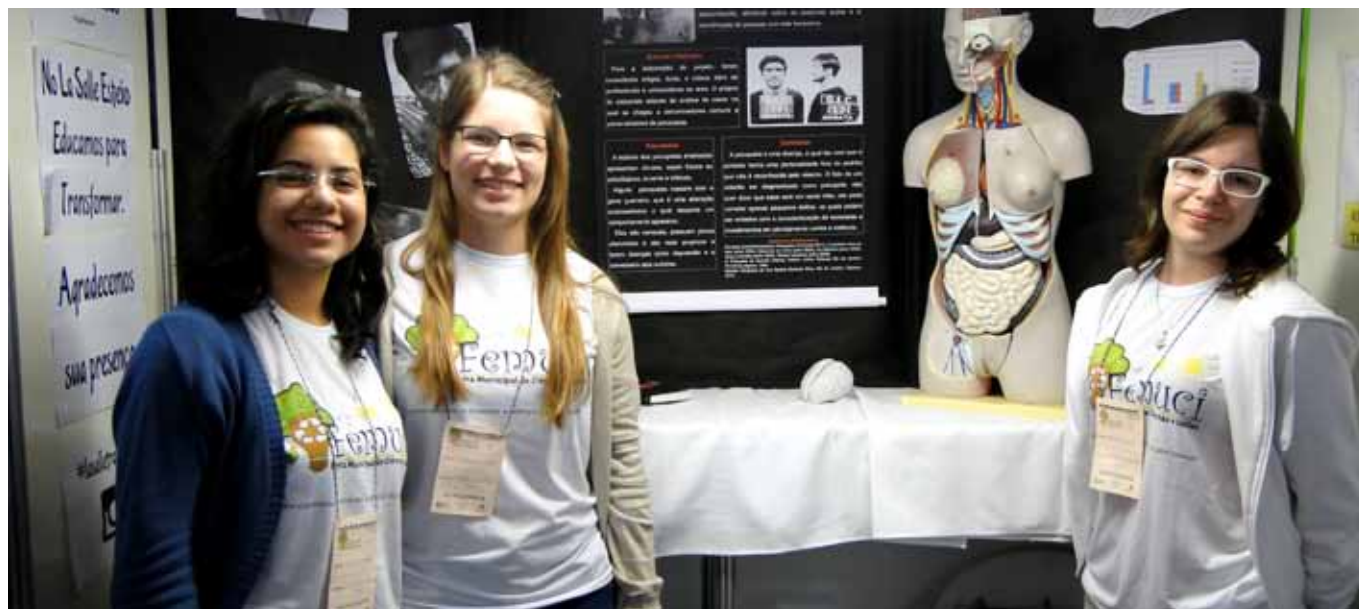
Trabalhos foram apresentados na Feira Municipal de Ciências e Ideias

A participação em feiras científicas promove a integração entre as instituições de ensino potencializando o aprendizado dos alunos, possibilitando a troca de informações, o desenvolvimento e a divulgação de projetos científicos.