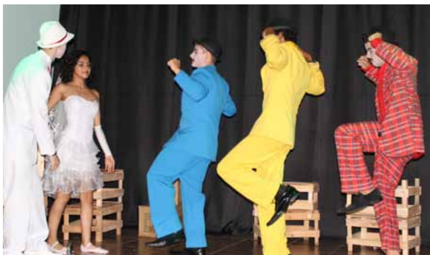
Projeto estimulou a pesquisa e o exercício criativo

O projeto também atendeu especificamente à proposta da Universidade de Brasília no Programa de Avaliação Seriada, de acordo com a sua Matriz dos Objetos de Conhecimento e Avaliação, nas três etapas do Ensino Médio.