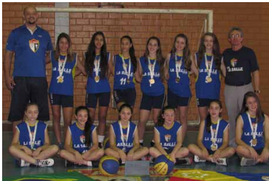
Equipe vencedora do JEJ 2015: motivo de orgulho para o La Salle Peperi e para o país

Eram 12 horas e 12 minutos do dia 12 de setembro de 2015 quando, entre abraços de alegria e choro, o grito de “é campeão” ecoou no Ginásio Náutico Atlético Cearense, em Fortaleza/CE. Era a equipe do Basquete Feminino La Salle Peperi (12 a 14 anos) comemorando a conquista inédita nos Jogos Escolares da Juventude (JEJ), maior celeiro de atletas olímpicos do país. Um feito histórico para São Miguel do Oeste, o maior do basquete feminino de base de Santa Catarina, além de credenciar o La Salle Peperi a representar o Brasil nos Jogos Escolares Sul-Americanos, no Paraguai, em dezembro.