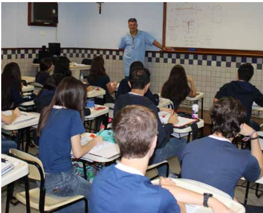
Integrantes da comunidade educativa são protagonistas de seu processo pedagógico