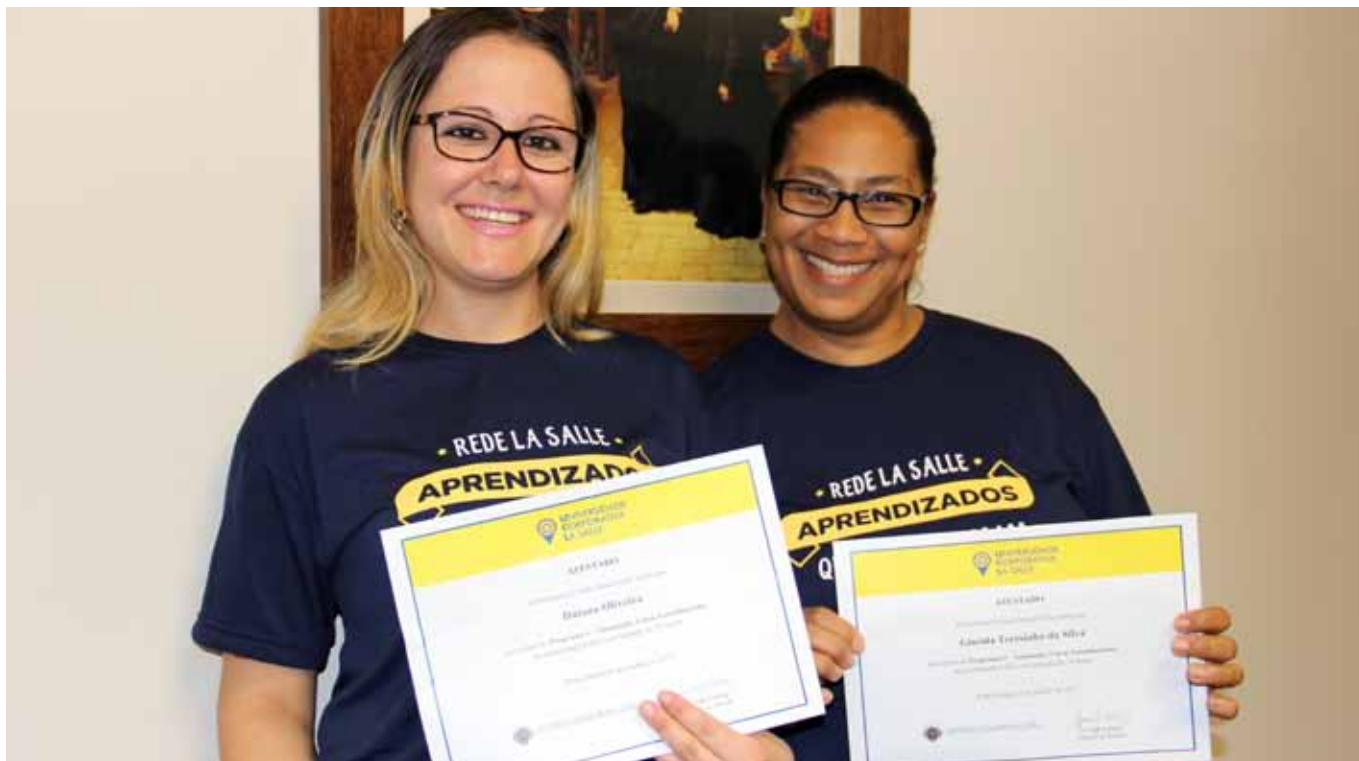
Colaboradoras mostram com orgulho seus certificados de participação no curso

Assessoria Educacional/Tecnologia Educacional da Rede La Salle e integrante do GT Formação Lassalista na Modalidade EAD