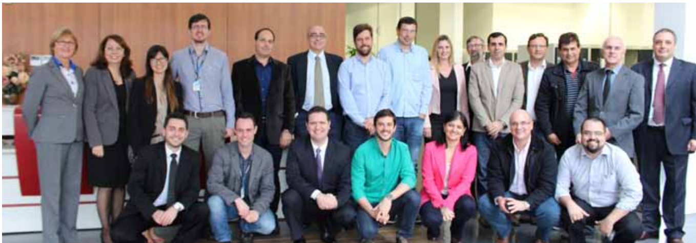
Comitativa Empresarial do Centro Lassalista de Estudos, Planejamentos e Tecnologias (CLEPT)

Setor de Comunicação e Marketing do Unilasalle Canoas