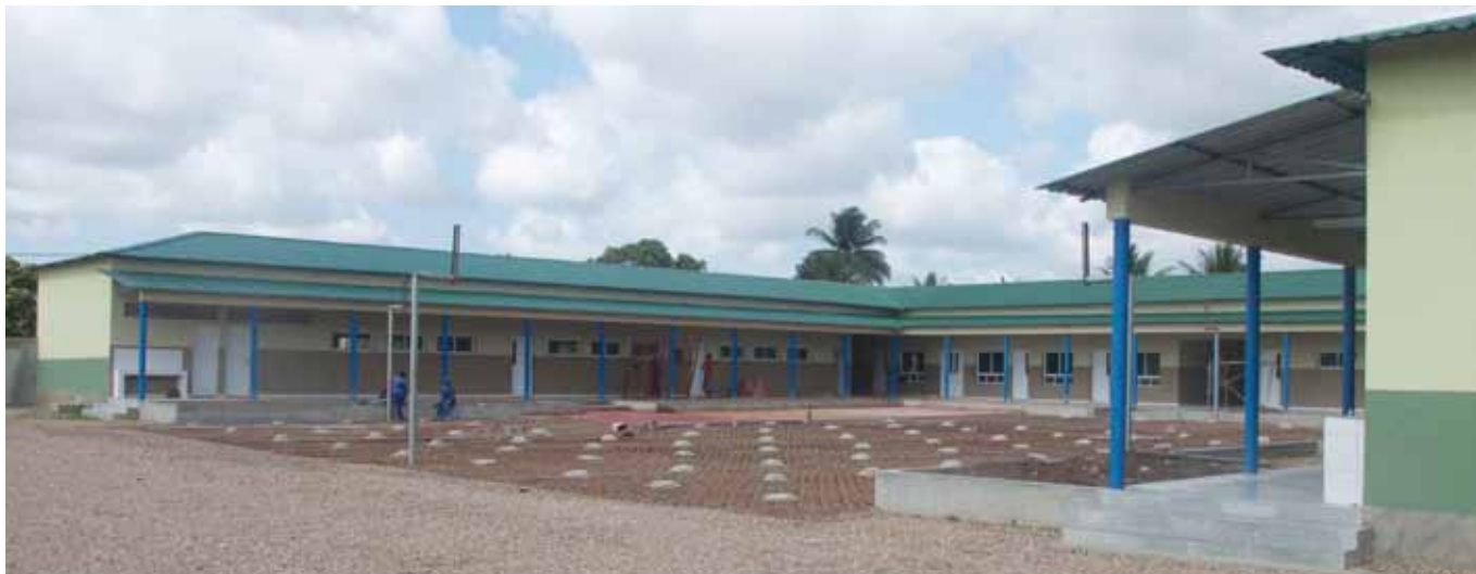
Instalações do Colégio La Salle Beira, em Moçambique

Setor de Comunicação e Marketing da Rede La Salle