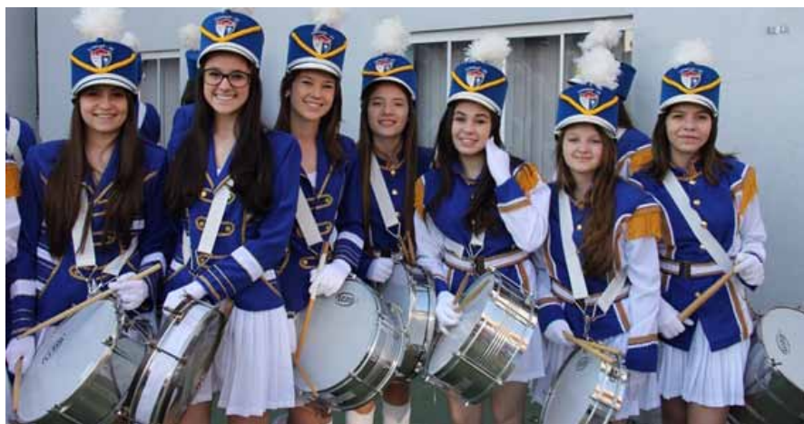
Banda do La Salle Xanxerê participa de desfile cívico

ano do Ensino Fundamental à 3ª série do Ensino Médio. E também com um outro, formado por ex-alunos e pais de estudantes. A proposta de trabalho oferecida foi atualizada pelo maestro Junior, que trouxe sua experiência musical de gravações e shows, conquistando um resultado integrado ao desenvolvimento musical e pessoal dos alunos.