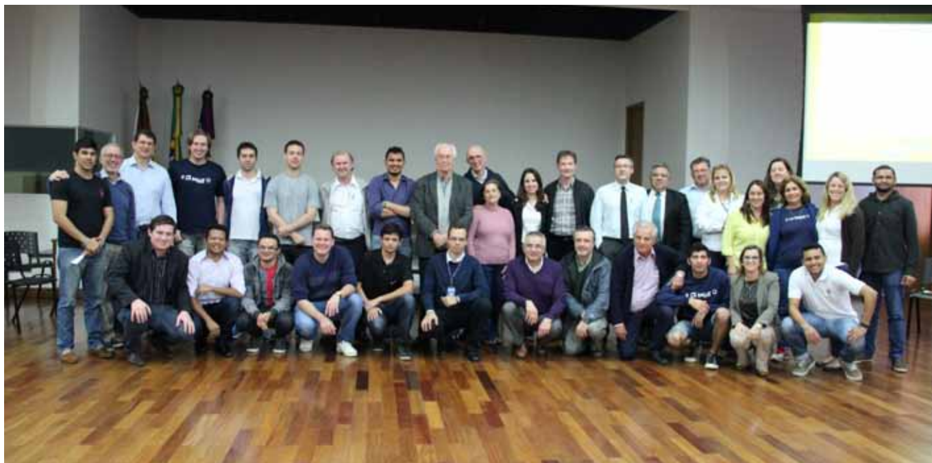
Painéis de 2015 foram coordenados pela Comissão de Formação e Vida Consagrada e reuniu Irmãos, Formandos e Leigos

Com o intuito de avançar no tema sobre a Partilha do Carisma e pensando em formas e em modalidades mais adequadas para a Província La Salle Brasil-Chile, Irmãos e colaboradores leigos reuniram-se na 3ª edição do Painel da Comissão de Formação e Vida Consagrada, no Colégio La Salle São João, em Porto Alegre/RS, para analisar e discutir a primeira versão do documento da Proposta de Partilha do Carisma Lassalista.