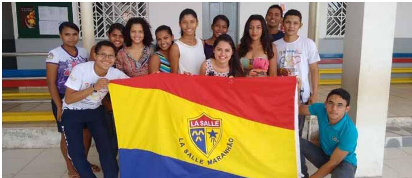
Colégio La Salle Zé Doca: convivência fraterna, solidária e aberta a todos

Setor de Comunicação e Marketing da Rede La Salle