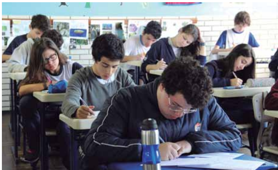
Dados advindos da Avaliação possuem relação com competências e habilidades

Ressalta-se que as Matrizes de Referência, tanto do Ensino Fundamental quanto do Ensino Médio, possuem o diagnóstico de um conjunto de competências (desdobradas em habilidades e conhecimentos) como eixo estruturante, com o intuito de identificar aquelas desenvolvidas, bem como, as que necessitam ser retomadas nos processos de ensino e aprendizagem. Assim, os itens avaliativos foram construídos com base nessas Matrizes, englobando nos instrumentos de avaliação dados com diversos níveis de complexidade.