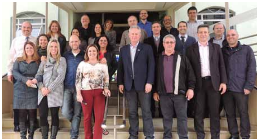
Encontro com Equipes Diretivas em São Paulo/SP

Setor de Comunicação e Marketing da Rede La Salle