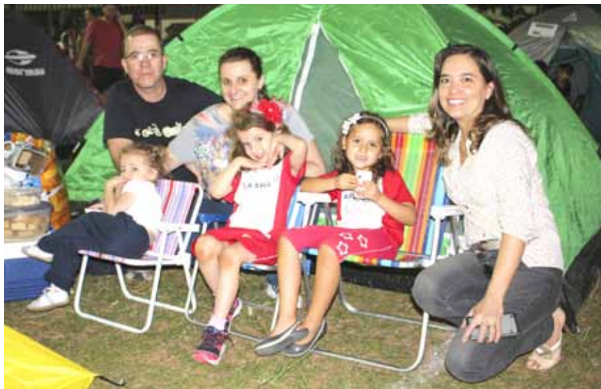
Acantonamento fez parte da programação da Semana da Família

Neste ano, o tema foi “Servindo com amor”. Valores lassalistas, como