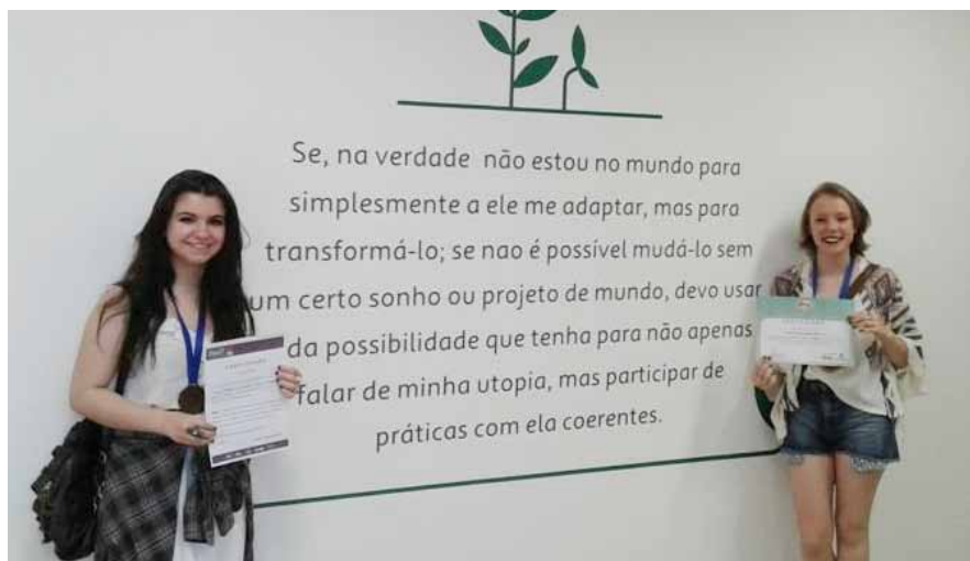
Alunas do La Salle Carmo e a homeopatia que substitui agrotóxicos: premiação em evento