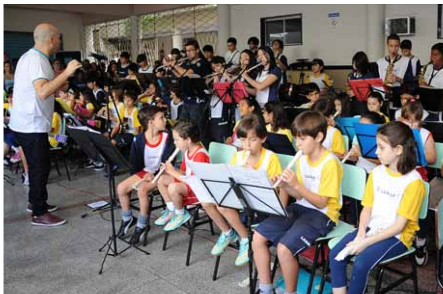
Orquestra do La Salle Abel: desenvolvimento musical e pessoal dos alunos

Esses e outros tantos exemplos culturais lassalistas transformam, a cada dia, pequenos talentos em revelações na música, na dança, na interpretação. É a educação somando-se às bonitas possibilidades do universo da arte.