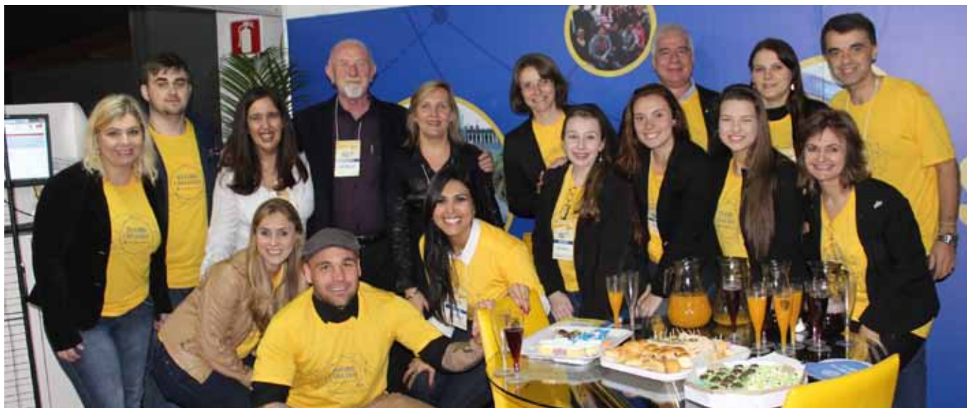
Autoridades e parceiros brindaram com a equipe da La Salle na Multifeira

Assessoria de Comunicação e Marketing da Faculdade La Salle Estrela