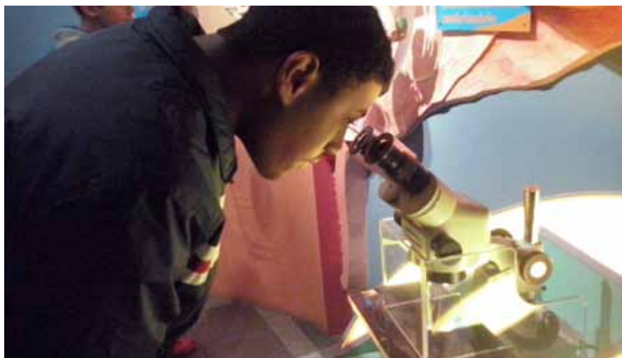
Aluno analisa o mundo de forma racional e inteligente

Integrante do corpo docente da Escola Fundamental La Salle Esmeralda