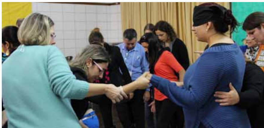
EPEL no Rio Grande do Sul desenvolveu dinâmicas

A realização do EPEL foi feita por regiões como de costume, congregando equipes diretivas, educadores e demais colaboradores, e sendo concluída em outubro.