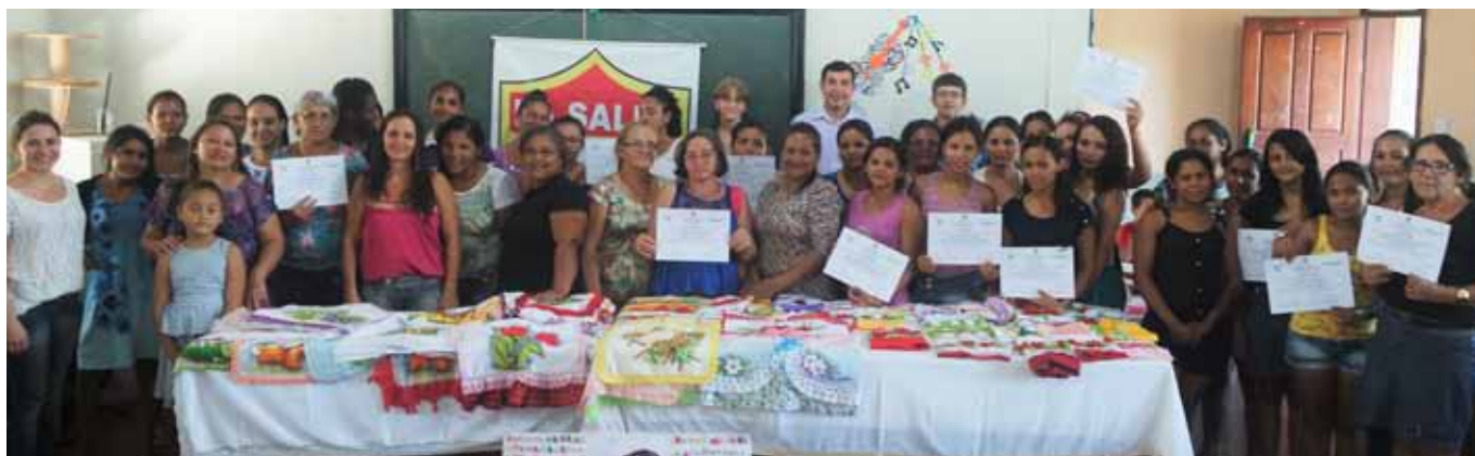
Turmas de Pintura em Tecidos, Bordado em Fitas e Embelezamento de Pés e Mãos