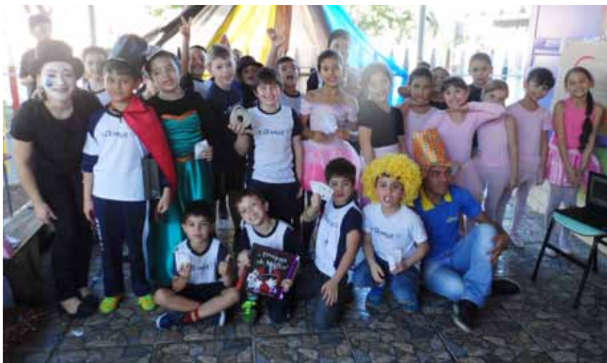
Projeto do La Salle Sapucaia desenvolve a criatividade e ressignifica relação com o circo

As transformações lassalistas, que começam na sala de aula e se estendem para a vida, também acontecem nas próprias instituições, as quais evoluem com o passar do tempo, adequando-se às demandas de suas realidades. Diversos exemplos na Rede La Salle mostram que o dinamismo das Obras as fortalece perante a comunidade e possibilita a formação de cidadãos melhor preparados para enfrentar os desafios do mundo.