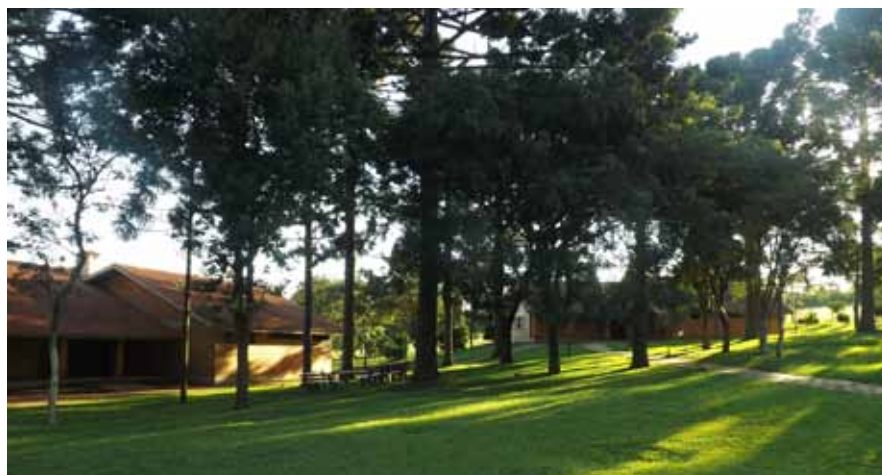
Local é complexo de lazer, de formação e de cultura

Rua Sergipe, 655, em Carazinho. Contato: (54) 3331-1344 ou eventoscarazinho@lasalle.org.br