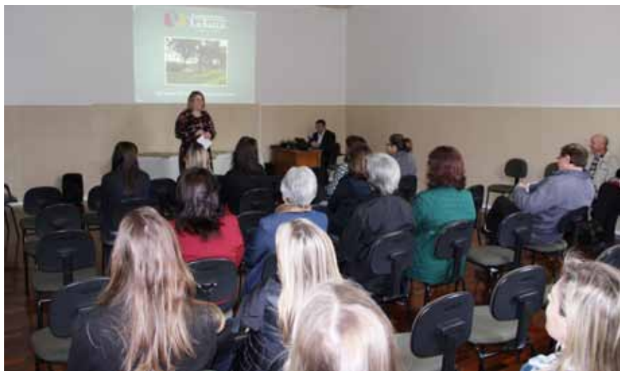
Lançamento foi prestigiado por convidados e pela imprensa

Setor de Comunicação e Marketing da Rede La Salle