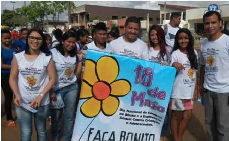
Transformação social acontece com projetos que visam à educação para a vida

Vice-Direção e Coordenação de Ensino do Centro de Assistência Social La Salle de Altamira