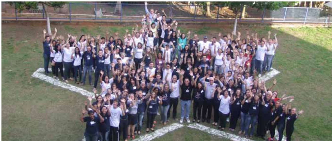
Encontro em Lucas do Rio Verde, no Mato Grosso, marcou início do EPEL 2015

Setor de Comunicação e Marketing da Rede La Salle