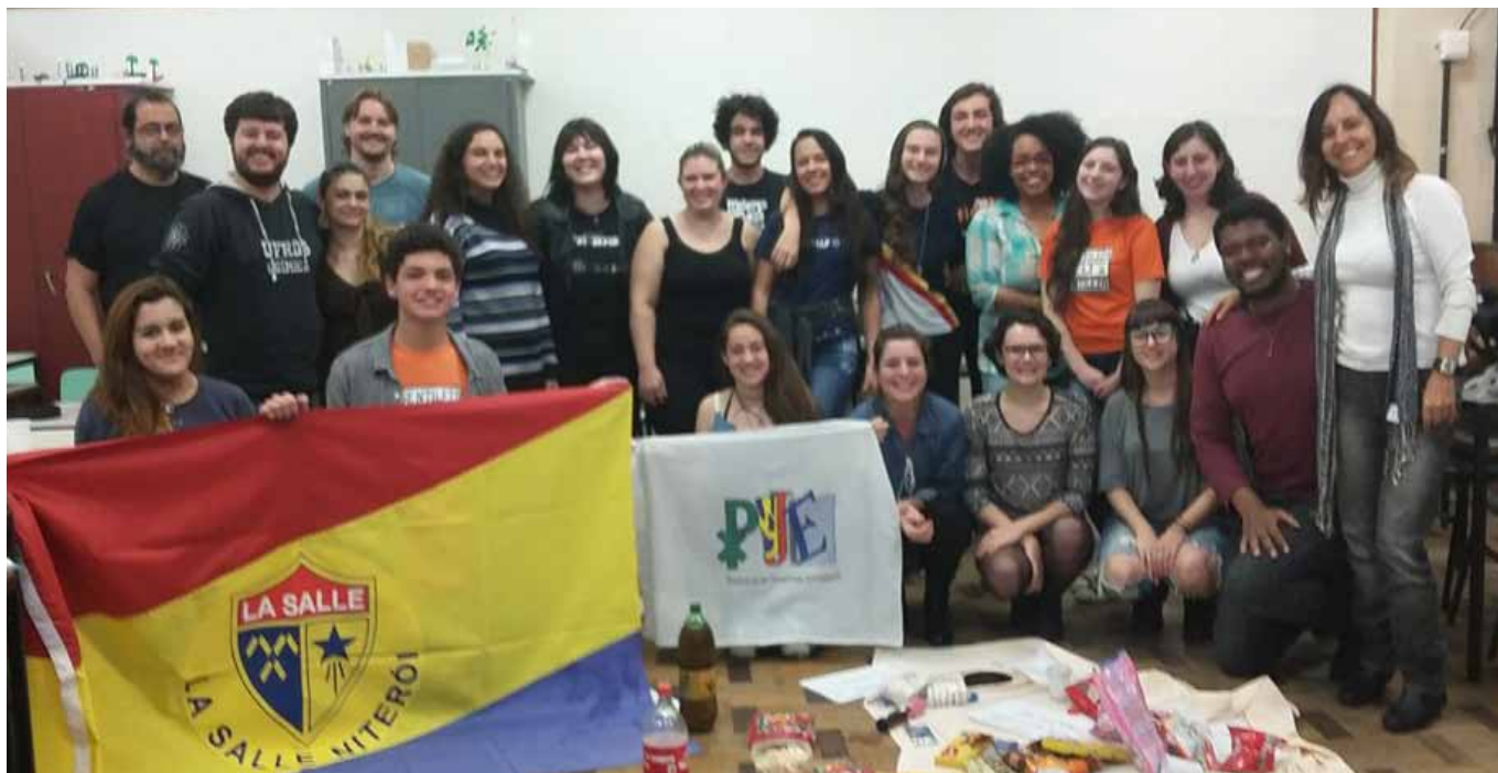
Alunos do La Salle Niterói interagiram com universitários da UFRGS

Coordenação de Pastoral do Colégio La Salle Niterói