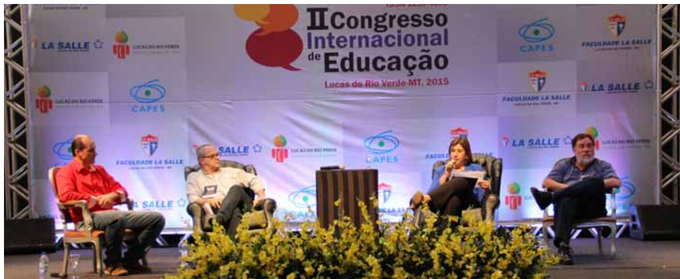
Nomes da educação nacional e internacional debateram questões e desafios educativos

Setor de Comunicação e Marketing da Faculdade La Salle Lucas do Rio Verde