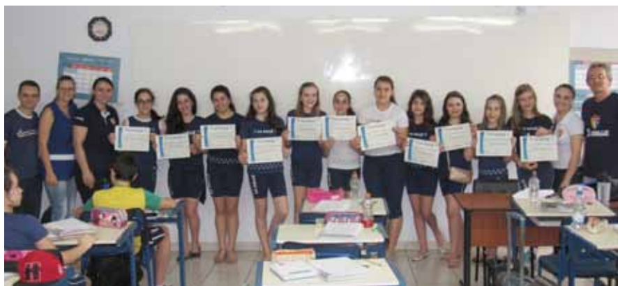
Premiar estudantes valoriza e enfatiza a importância da dedicação aos estudos

Ainda hoje, quando um professor explica algo para o aluno desejando que essa informação seja retida, solicita-lhe que a devolva por escrito em uma prova e que, ao fazê-la, mostre sua inteligência. Negar totalmente o valor dessas medidas de inteligência seria ingênuo; mais ingênuo, entretanto, é acreditar que a avaliação dessa ou daquela capacidade pode efetivamente quantificar quão inteligente a pessoa é. [...] Não se pretende com tudo isso clamar para que a escola não mais avalie seus alunos por meio de provas, mas que essa avaliação identifique e diagnostique, tanto quanto possível, a ampliação das competências do aluno. Essa imensa diversidade da sua identidade que se manifesta nas respostas dadas, nos desafios lógicos que supera, na musicalidade que empolga a todos, nos devaneios que arquiteta, na sensibilidade com que interroga e, sobretudo, na felicidade social que aprende a construir e, apesar dos pesares, a preservar (ANTUNES, 2008, p. 38, 39).