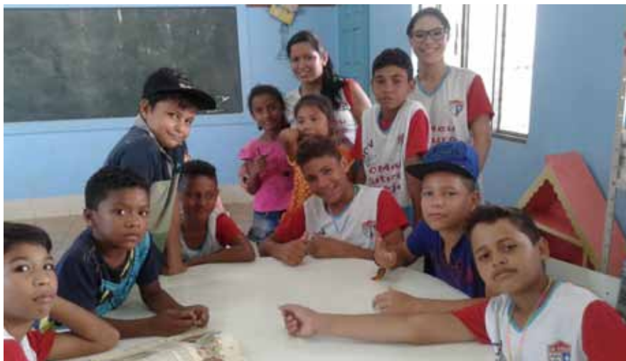
Missão educativa lassalista desenvolvida pelos Centros Assistenciais tornou-se referência

[...] percebemos sinais de esperança e de transformação, que se expressam nos movimentos sociais, no clamor por mais justiça, segurança e educação de qualidade para todos, na preocupação com o meio ambiente e a sustentabilidade, no respeito, na promoção e na defesa