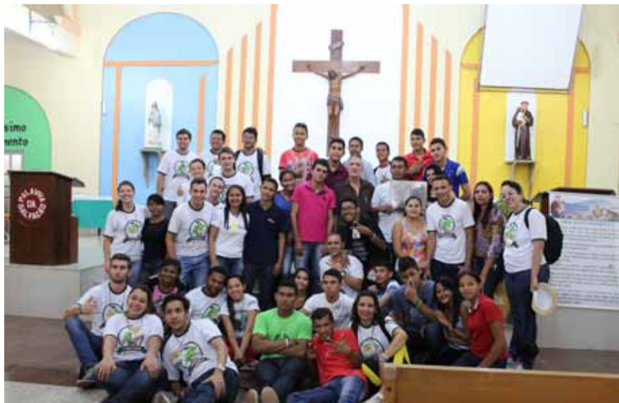
Momento oportuno para reflexões sobre opções de vida dos participantes

Serviço de Pastoral da Província La Salle Brasil-Chile