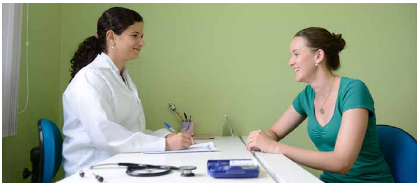
Alunos do Unilasalle Canoas vivenciam ações de voluntariado e de projetos sociais

a outras entidades. É o caso do projeto Mesa PROBICE por los Derechos de la Infancia, que acontece no Chile. Envolve a Comunidade Lassalista do país e conta com o apoio de demais instituições vinculadas à Igreja.