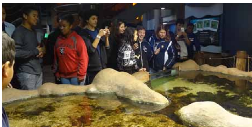
Estudantes visitaram museu da PUCRS

Em livro didático, os educandos aprendem a relação entre ciências e linguagem, por meio do estudo de textos de divulgação científica e de artigo enciclopédico. Assim, com a ida ao museu, nossos estudantes obtiveram conhecimentos pela arte, ciência, tecnologia, astronomia, natureza, fauna e flora reunidos em um só lugar, totalmente à disposição para vivenciar novidades.