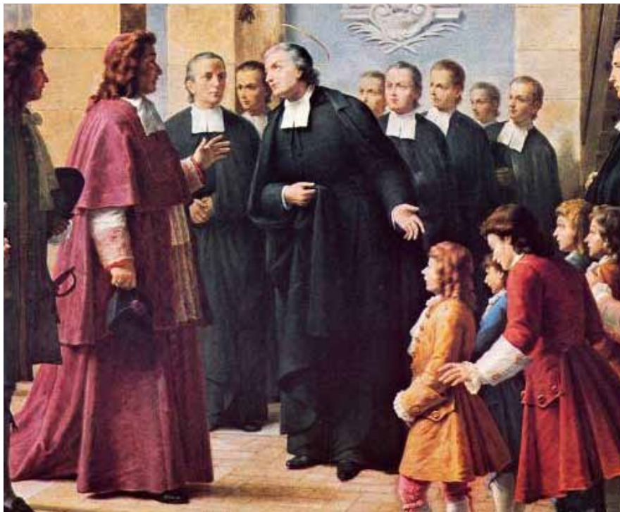
Associados entre si e com La Salle, pioneiros criaram e consolidaram uma obra educativa

Como sabemos, La Salle escolheu viver como eles. É de dentro deste