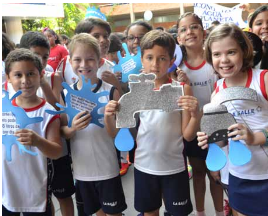
Estudantes do La Salle Manaus aprendem o valor da sustentabilidade

Pedagoga, Mestre em Educação (EUA), Doutorado em Gestão (EUA e Brasil), Pós-Doutorado em Formação de Professores e Infância (Itália e EUA). Atuou na rede pública do município de São Paulo como professora, coordenadora e diretora de escola. Participou de projetos nacionais e internacionais ligados ao BID, Banco Mundial e às Nações Unidas, assumindo a Coordenação do Escritório da UNESCO em São Paulo. Especialista em infância, é representante do Brasil no World Forum Foundation e Global Leader for Young Children. Sua proposta é contribuir com a Rede La Salle e seus educadores no processo de revisitar as matrizes curriculares.