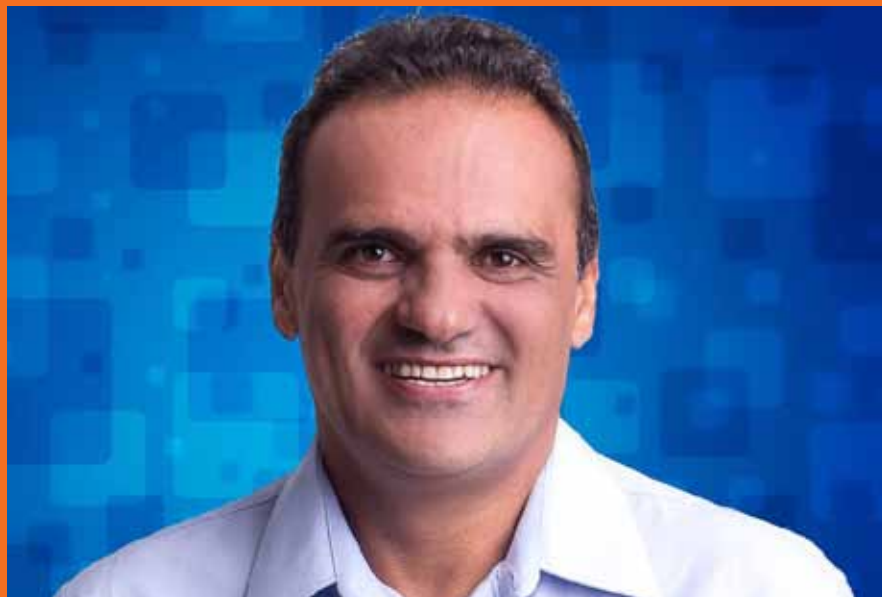
Tercio iniciou sua trajetória na Rede La Salle nos anos 90

Tercio – Exatamente a forma como ele transformou a maneira de ensinar, priorizando os valores humanos e cristãos do indivíduo. O profissional, quando capacitado, tem as ferramentas para transformar a vida de outras pessoas, e La Salle fazia isso muito bem.