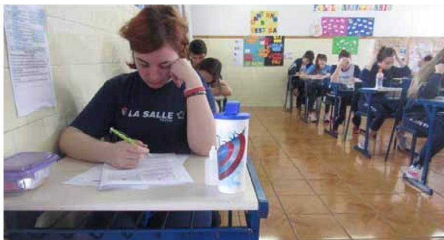
No ano de 2014, Avaliação foi reestruturada. Na imagem, alunos do La Salle Peperi

Para 2016 pretende-se tornar a Avaliação de Conhecimentos, com maior ênfase, um diferencial rumo ao que o Projeto Provincial determina em seu planejamento: escolas lassalistas rumo à excelência na educação, não só em resultados externos, mas principalmente na formação integral dos alunos, tornando-os capazes de serem protagonistas de seu projeto de vida para bem viver.