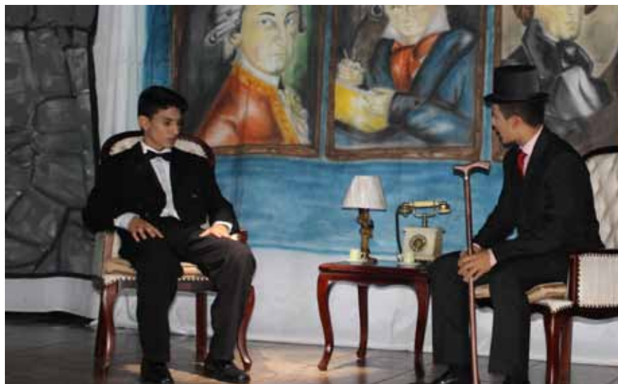
Educandos recriaram histórias

Recriaram histórias de acordo com as características de cada movimento literário, bem como as interações histórica, filosófica, social e, efetivamente, cênica, além de desenvolverem habilidades de