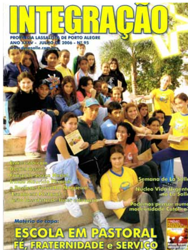
Integração de 2006 destacou a Escola em Pastoral

Na revista, houve uma análise maior das práticas de Escola em Pastoral naquela época e de como as instituições educam para o bem viver no século XXI. Iniciativas que começavam na sala de aula e beneficiavam a comunidade foram exemplificadas aos leitores, como jornadas de formação, dinâmicas, voluntariado e