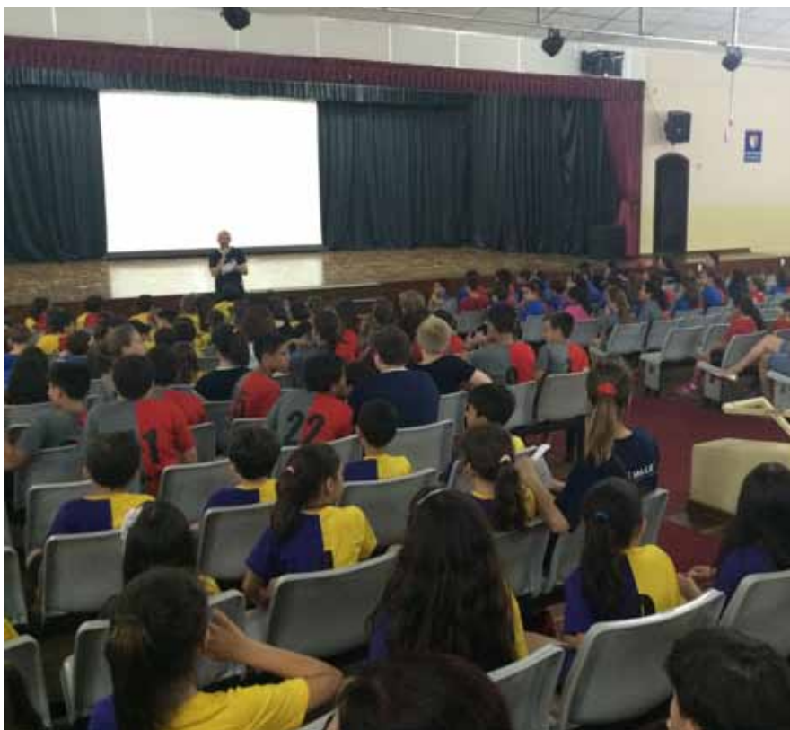
Acampamento oportunizou trabalho em equipe, respeito e fraternidade