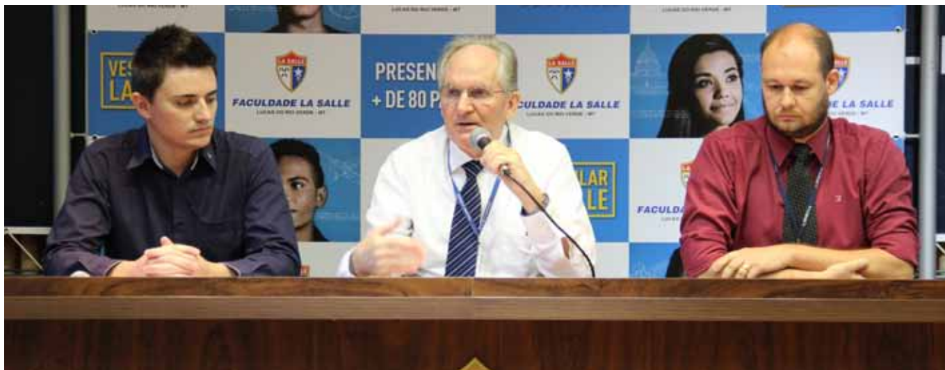
Novos cursos foram apresentados em coletiva de imprensa durante lançamento oficial do Processo Seletivo 2016

Setor de Comunicação e Marketing da Faculdade La Salle Lucas do Rio Verde