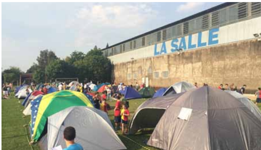
Com apoio de familiares, professores e funcionários, alunos montaram suas barracas

Depois veio o jantar, um breve descanso e uma animadíssima brincadeira noturna, com lanternas, utilizando todos os espaços da escola. Lá pelas duas horas da manhã, todos se recolheram nas barracas e nas salas de aula para o descanso. Mas já cedo, às sete horas, estavam quase todos em pé, para o café da manhã, a desmontagem das barracas e o retorno para casa. O Acampamento La Salle deste ano contou com a participação de 220 crianças que vivenciaram uma experiência inesquecível de aprendizagem transformadora, de cooperação, de autonomia, de trabalho em equipe, de respeito e de fraternidade.