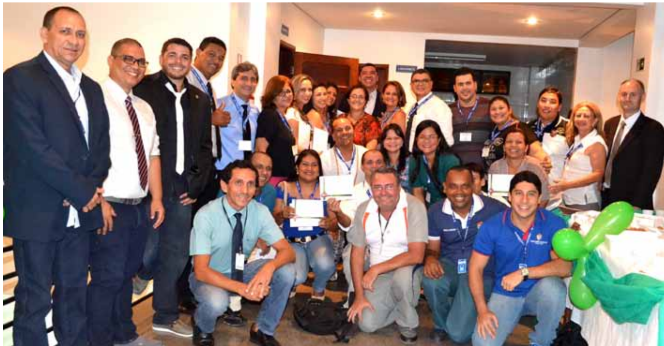
Egressos foram homenageados e receberam um certificado de agradecimento por suas contribuições

Assessoria de Comunicação e Marketing da Faculdade La Salle Manaus